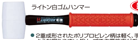
ライトン白ゴムハンマー