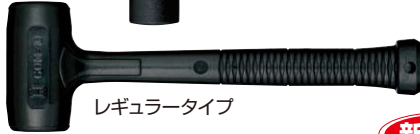
レギュラータイプ